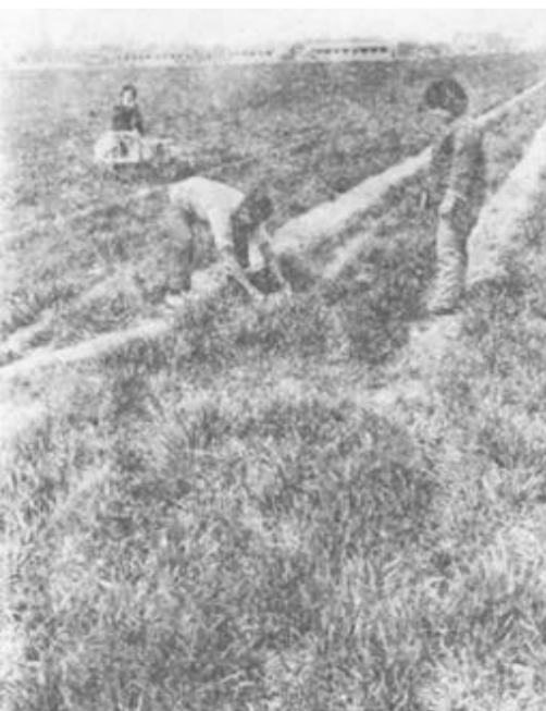
广饶县45万亩小麦长势喜人。图为农民正在加强田间管理。

三乡为主的羊生产基地；以花官、丁庄、陈官为主的大牲畜生产基地；以县良种鸡场为主的肉食鸡生产基地；千家万户一齐上的肉食兔生产基地。据去年年底的统计，全县生猪存栏6.1万头，羊5.85万只，大牲畜4.2万头，分别比上年增长99.4%、25.7%和12.9%，肉食鸡基地已形成规模，辐射9个乡镇。为推动畜牧业发展，再上新台阶，全县形成了防疫网络，建成了县城、大王、花官三处规模不等的冷藏设施，出现了生产、防疫、加工、销售一体化的新局面。