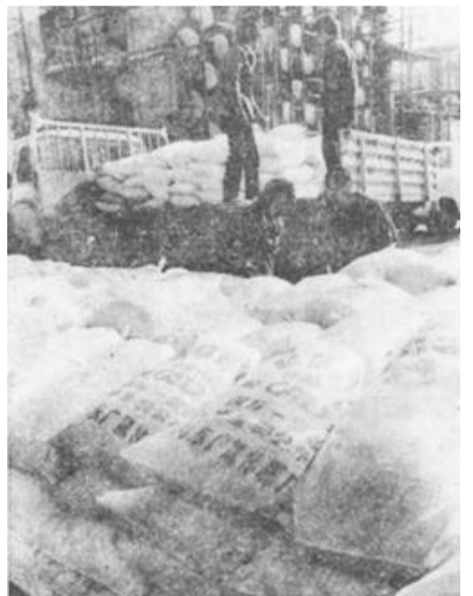
县化肥厂生产的“碳酸氢铵”源源不断地运往农民手中。

广饶县的县属工业起步较晚，基础较差，1978年年产值仅有3005万元，产品种类单调，缺乏行业优势。近几年来，全县在县属工业的发展上逐步确立了从实际出发、发挥优势、突出骨干、保证重点的指导思想，使产业结构、产品结构日趋合理完善。在实施过程中，一是突出抓好骨干行业与产品，强优淘劣。广饶县的盐业已有数千年的历史，是该县的支柱产业之一，去年冬天，全县投资3000多万元，开发、改造盐田21.3平方公里，1990年投产后，可形成30万吨原盐生产能力，产值达到3000多万元，获利税1600多万元。自1984年以来，全县共投资8220万元进行技术改造与新产品开发，增强了工业发展的后劲，同时对6个经济效益差，缺乏市场竞争能力的县属工厂实行了关停并转。二是发挥资源优势和市场优势，使之转化产业优势和产品优势。目前，县属工业已形成包括石油化工业、建筑建材业、机械加工业、服装鞋帽业、农副产品加工业等门类比较齐全的产业结构体系。县播种机厂新开发的抽油机等产品在油田打开了销路。县化肥厂的配套炼油装置易地改造工程已开始实施，投产后将为全县发展石油化工业起到“龙头”作用。